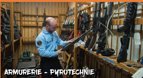
ARMURERIE - PYROTECHNIE